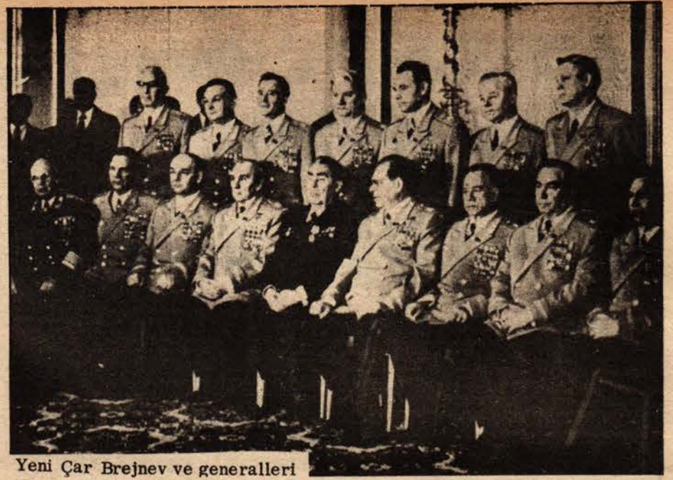
Yeni Çar Brejnev ve generalleri

İkinci olarak, Podgorni'nin son zamanlarda Sovyetler Birliği'nin Or- tadoğu ve Afrika'da uğradığı baka- rısızlıklardan sorumlu tutulduğu anlaşılmaktadır. Podgorni'ye bu suçlamayı yöneltenler, Rusya'nın bu bölgelerde şimdiye kadar elde ettiği mevzilerle yetinmeyen ve çok daha büyük ihtiraslar taşıyan kim- selerdir. Bu açıdan Kremlin'deki son değişiklikler, sosyal-emperya- listlerin ülkemizi de pençelerine almak için daha çok çaba sarfet-